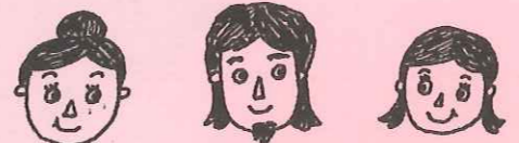
はは(こもだる) ちち(たぶんちち) みゆう(娘) 偉らく母 偉らく父 平成10年生まれ

こもだる(狐梅)とは黨(わら)の狐(こも)でくんだ酒樽のこと。お酒を愛しすぎて自分のあだ名にしてしまいました。